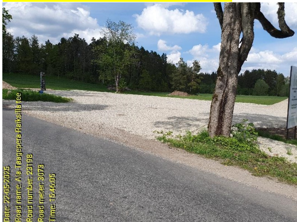
Vaade omavoliliselt ümberehitatud ristumiskohale 22.05.2025